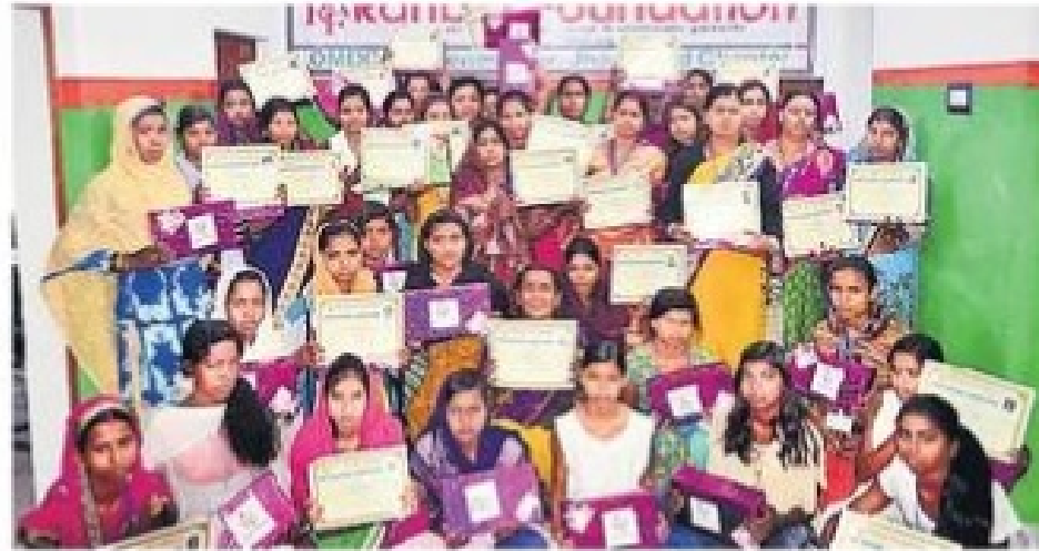
सिलाई का कोर्स पूरा करने के बाद प्रमाण पत्र के साथ महिलाएं।