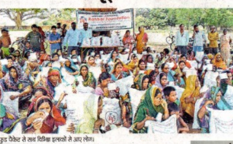
फूड पैकेट से लाभ शीर्षक इलाके के आने लगे।