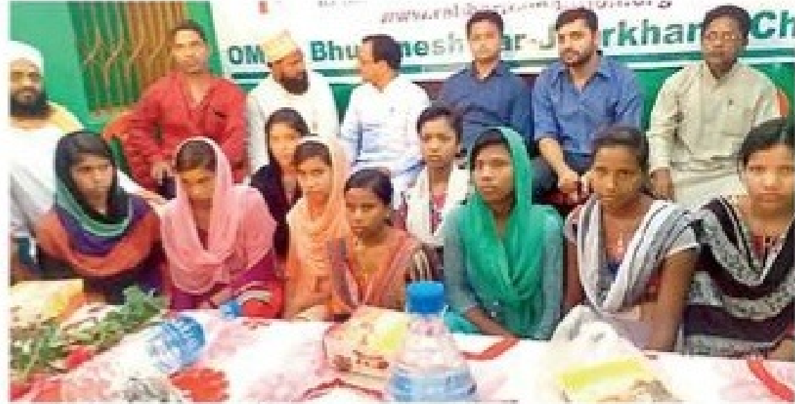
सिलाई केंद्र में उपस्थित वधियां।