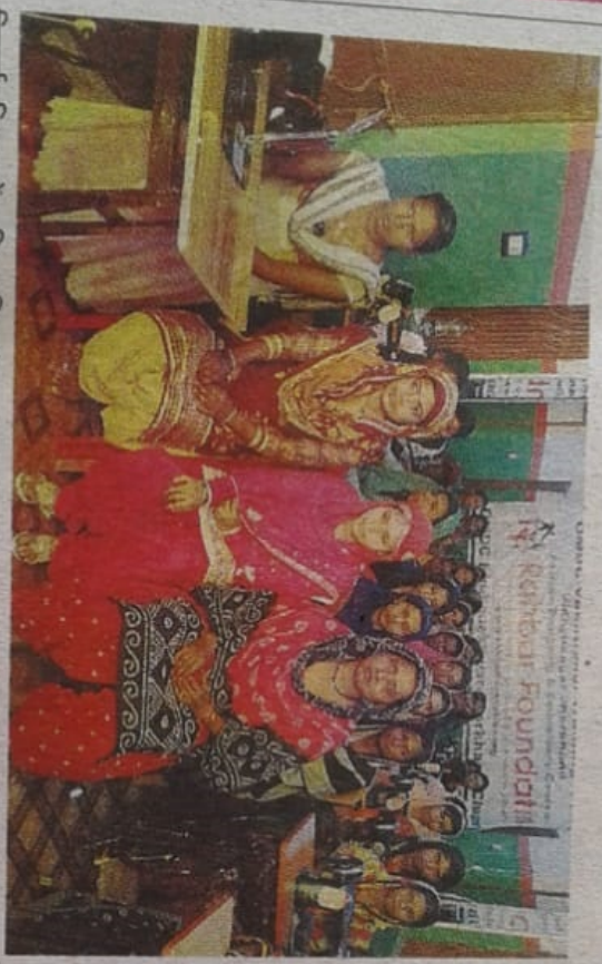
सिलाई प्रशिक्षण में शामिल महिलाएं