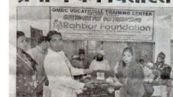
पुरस्कार करते संस्था के पदाधिकारी।