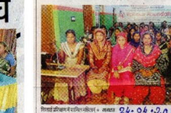
सिलाई-कढ़ाई सीख रही महिलाएं । जामताड़ा : 24-04-2018